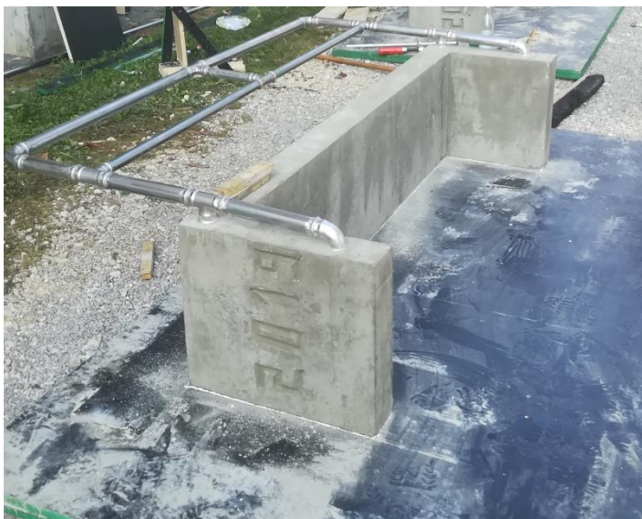
Eine von Schülern gefertigte Betonbank